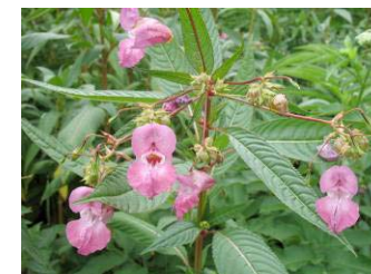
Impatience de l'Himalaya