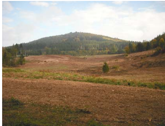
Ces travaux réalisés par M. JUCKERT permettent de mettre en valeur la silhouette boisée de la côte d'Ortomont

Exemple d'une réalisation de grande ampleur (6ha) entreprise cette année sur la commune de Ménil de Senones au pied de la côte d'Ortomont (direction Châtas).