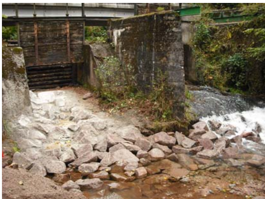
Passe à poissons réalisée en septembre à l'étang de la digue à Moussey par Nature et Technique