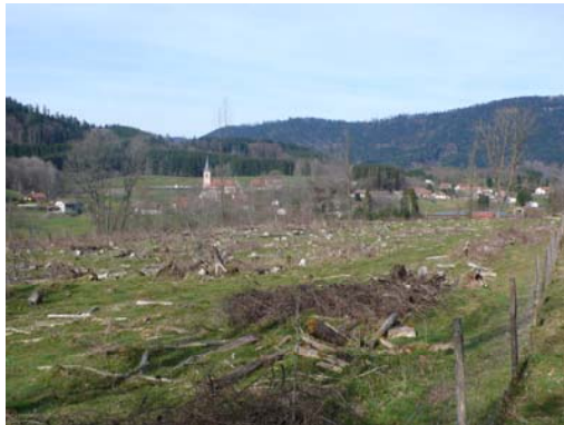
Vue depuis la route vers Le Puid