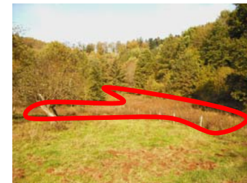
Zone humide de 1ha au lieu-dit le « Haut du village » à Le Saulcy

Plusieurs rencontres sur le terrain avec la Direction Départementale de l'Environnement et de l'Agriculture des Vosges, l'Agence de l'Eau Rhin Meuse et la mairie de Le Saulcy, ont défini les modalités de gestion de ces espaces : pâturage extensif et fauche de fin d'année en période sèche.