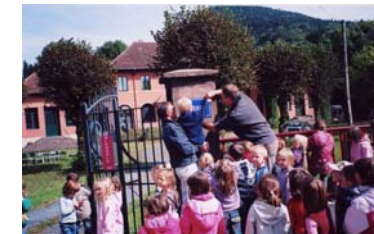
Pose d'une plaque de signalisation du Rabodeau par l'école Faller dans les 4 communes

Le dispositif de la plate-forme EEDD co-animée par le Conseil Général des Vosges et l'Inspection Académique, a permis aux écoles de bénéficier d'un appui pédagogique, technique et financier. Ce sont près de 500 enfants qui ont été concernés par cette action en 2009.