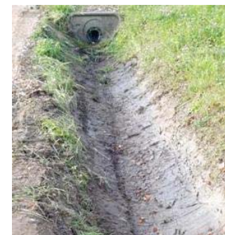
Création de fossés préconisés à des dimensions de 40cm *40 cm