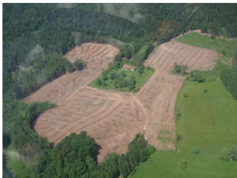
Vue aérienne après exploitation du site

Ce projet situé au lieu-dit « Les Grandes Gouttes » et séparé en deux parties par un chemin rural, est en continuité d'un îlot agricole de 9 ha. Il témoigne de la volonté du conseil municipal d'entamer une politique d'ouverture du paysage autour du village.