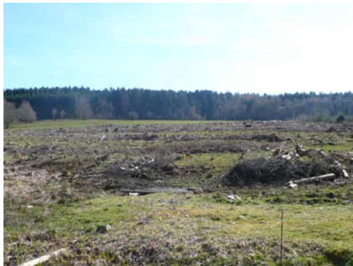
Vue en face du château de Belval